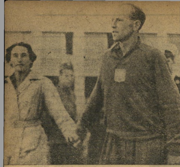
גם זר פרחים. כשקיבל "הקטר הצ'כי" — סרן אמיל זסופק — את מדליית הזהב השלישית שלו רץ מיד לאשתו זנה, הציע לה, למחזאות כפיהם של 70 אלף הצופים, את המדלייה וזר פרחים.