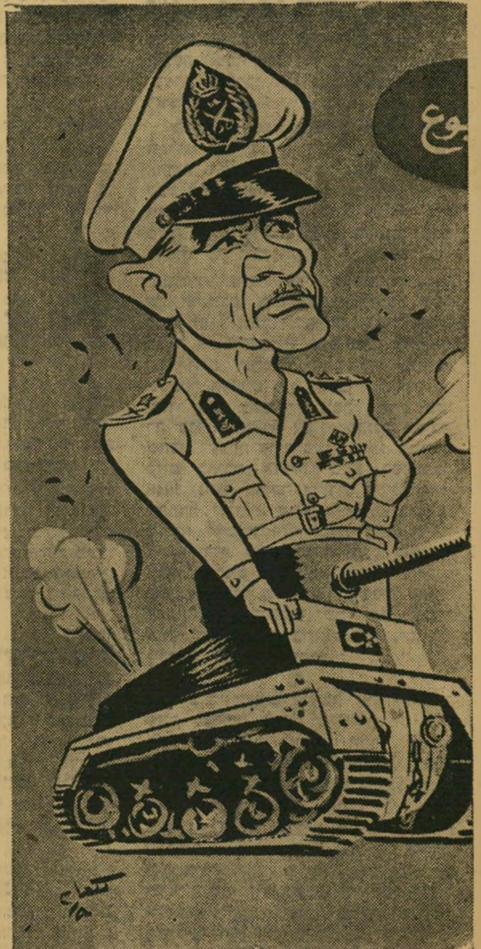
גנרל מוחמד נגיב למהפכה צרפתית, הגילוסניה

עתה חי הזוג בפרבר ניו-יורקי, מגדל את בנו דוד, בן השנתיים. לייצ'ר המדופף לעתים קרובות באלבום הצלומי הגליל אינו בודע ב' חבריו שעתה לא יוכל להביא כל תועלת ב' סיכיות ההן, אך הוא מסכים אתם שלו עצמו תביא עתה ניו-יורק תועלת רבה יותר. מלבד הקונצרטים, את הכנסתם מקדיש ליי' צר לטובת המגביות, יסיים בשנה הבאה את לימודי המתימטיקה שלו באוניברסיטה הע' רוגית של ניו-יורק ואז הוא מתעתב לשוב ארצה לגלות יחד עם ידיעותיו המתמטיות את יכלתו הפסנתרנית לקהל הישראלי.