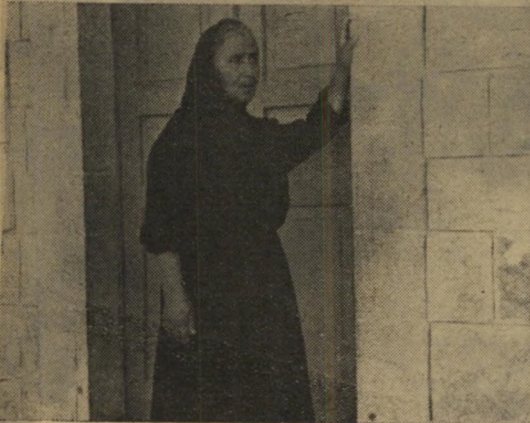
מכשלת המוסד "זהה תעמולה קומוניסטית!"