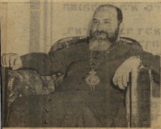
המיטון ג'ורג'י חכים עני לי מה לבדניו