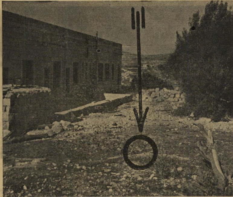
מקום הקבורה. זוהי תמונה כללית של החצר האחורית של מוסד היתומים בווספיה. העיגול מסמן את המקום בו גילתה המשטרה את שלד התינוק שנקבר שם בחשאי לפני שנה.