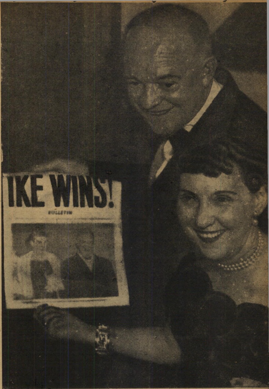
תרועת הנצחון. למחרת יום הבחירות כבר הסתמנה המהפכה הגדולה. אייק ואשתו, מאמי, אינם מסתירים עוד את שמחתם הצוהלת, שמחת העולם היתה מהולה בדאגות ובספקות.

קשה היה לענות על השאלה. אולם מכריו של האיש הסכימו עם פסק-הדין של המון הביחורים. הם זכרו פרשות מסוימות בעברו * עליו סטיבנסון הניב על מפלתו בדברי הילד שנפל בחושך. "היה גדול מדי מכדי שיפרוץ בכבי וזא יכול לצחוק מפני שזה כאב מדי."