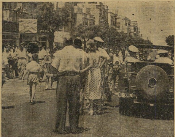
המשטרה אינה מתערבת: מכוניות של המשטרה הנייזות המתינו לאורך מסלול ההפגנה להוראות אולם לא הפריעה למהלכה. הרמקול עודד את השוטרים להצטרף להפגנת הנוער.