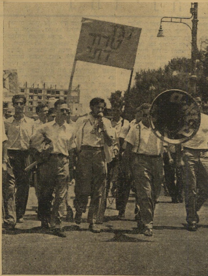
הנסיון הספונטאני: שעה שעשרת אלפי צעירים התרחצו בשפת הים אירגן ועד הנוער למלחמה בסרור הדתי, גוף בלתי-מפלגתי שהוקם למטרה זו, הפגנה ספונטאנית. בעזרת רמקול חזק שנישא על שכמם של ארבעה בחורים אתלטיים שידרו את דבריהם לאלפים, קראו להם להצטרף להפגנה. בתמונה: אורי אבנרי משדר תוך כדי הליכה, העתונים הדביקו להפגנה תו "כנעני".