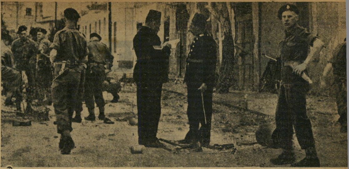
פינוי ואיחוד. כמעט מן היום הראשון לבוא הצבא הבריטי למצרים היו תביעות הפינוי של המצרים שלובות בתביעה נוספת: איחוד הסודאן למצרים. גם פרעות אזור הסואץ של השנה, שנסתיימו בקרב הגדול על תחנת משטרת איסמעיליה (למעלה) התנהלו בסיסונה זאת.