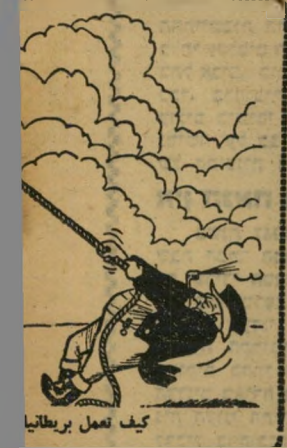
כיף תעמל בריטאניה

ד. מרימס האנגלים את מצרית זו, למטה: אל נחאס