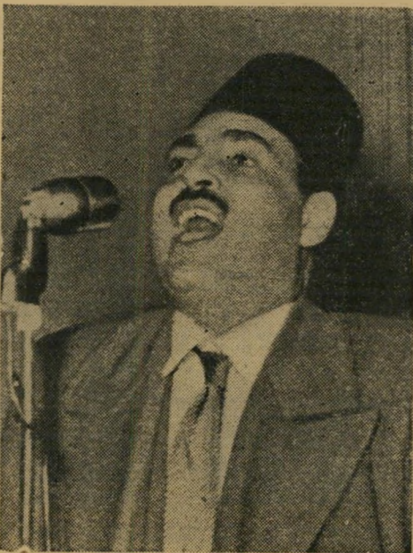
המנהיג אהמד חוסיין — אן נרו שיחק ששיבש

גם בעד האשמות הכבדות ביותר, בהן נמצא חייב, לא נידון המנהיג למות — הוא רק קיבל שנה וחצי מאסר. כי מחר נכונו לו תפקידים אחרים בשרות מלך