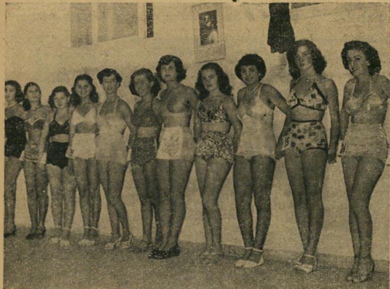
מיסדר מלכות המים 1951 של השבועון "קדנוע" המציאו שורת יפהפיות

אין פירוש הדבר שעורכי קולנוע ינופפו את הדגל הלבן מעל למבצר היופי. גם הם יבחרו במלכת מיים. מאחר שקנאת שבועונים מרבה יפהפיות, תהיה מדינת ישראל עתה המדינה היחידה בעולם שלא זה בכבד שתהיה לה מלכת מיים אחת, אלא אפילו שתיים. וכל זה נוסף על מלכת יופי ארצית ושתי מלכות יופי מחוזיות.