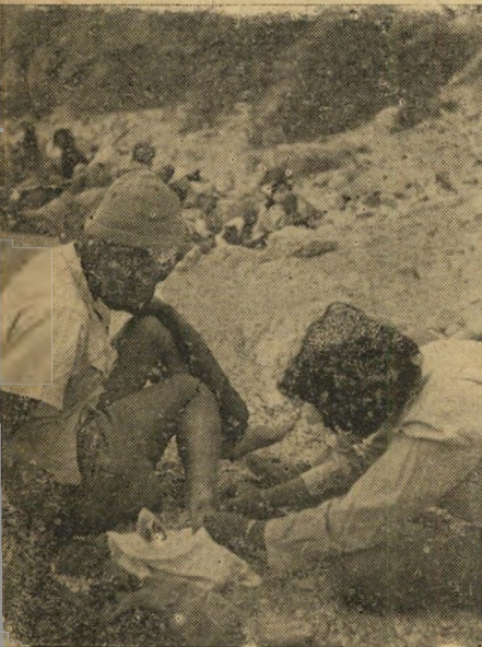
אותות כרגלים המיוסרות...

מיד לאחר שהערבים הספיקו להתחמם, קמו כמה מהם ואספו מהם השיחים שנערמו ליד המדורה, הוציאו מן האש גחלים בוערים והדליקו לעצמם מדורה נכרדת, מרחק כמה מטרים ממדורתנו. בידוד זה לא נבע מיהי- רותיחה, אולם לבני מדבר אלה חסר חוש המשמעת שיאפשר התחברות אתם. אילו נק- בעו יחסינו אתם על בסיס חברותי ושוויון