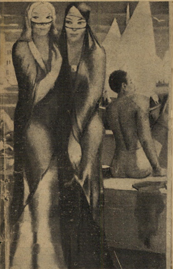
אמצעי גירוי. "בנאת אל-ניל" הוא השם שהציר נתן לתמונה אשר כל סביבתן נתונה עדיין למסורת הישנה של מסתורין ואיסור והעבאיה — כפי שעשו בנות העשירים — הפכו אותם לאמצעי גירוי