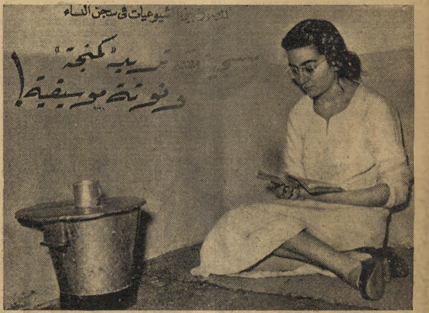
מוסיקה וקומוניזם. הכותרת הערבית, בשבועון המצרי אל-מוסאור, אומרת: "אסירה דורשת כינור ותווים מוסיקה". האסירה: סטורנטיט שנמצאה אשמה בפעילות קומוניסטית. לפני 30 שנה לא היה אדם יכול להגלות על זנתו כי מקומה של האשה הערבית חורג מגבולות המטבח וחדר הלידה. עתה הפכה השתתפותן של נשים בתנועות פוליטיות וציבוריות שכיחה ביותר.

תית. בסבלנות רבה ארגנה תהלוכת רחוב לפי רוח הסופרגניות הבריטיות בראשית המאה ה-20 נוכחית. מוזר הוא שלמרות ניהושי המשכילים המצרירים, שהאמינו כי ההפגנה תיכשל, היתה לה שהטילו מצור על בית-הנבחרים בדרשן זכות בחירה לנשים, יצאו לתגרות ידיים עם השוטרים ונאסרו בהמוניהן.