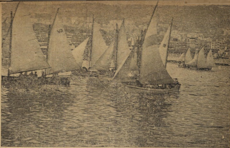
סירות שיוט החופים מוליכונות במפרשיהן המתוחים בכניסה לנמל חיפה.