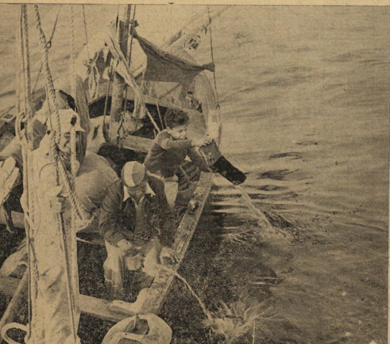
צוות אחת הסירות שנשטפו מים, דודה ושופך את מי הים הוצפה.