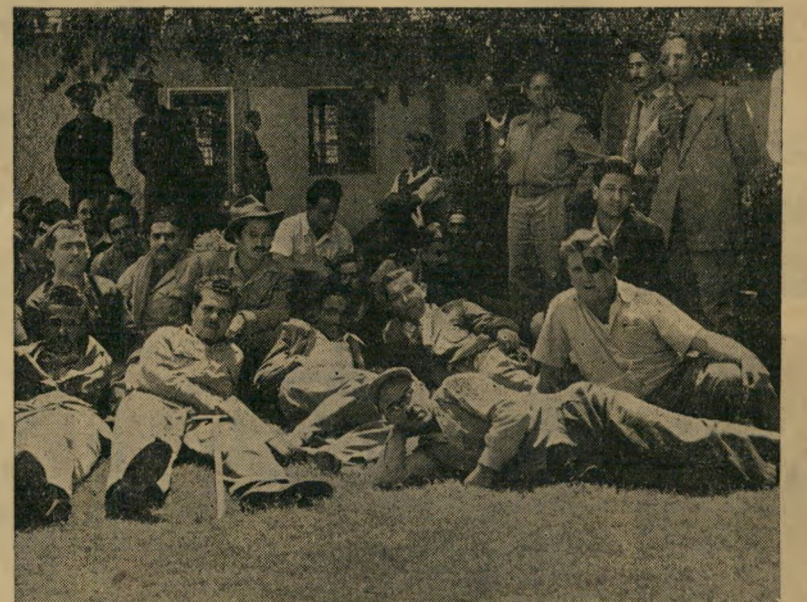
שביתת הנכים לפני משרד האוצר 300 קטועי רגל...

לפי דרגה ב', בשעתו קבעה הכנסת: לנכים בעלי אחוזי נכות נמוכים מ-50 אחוז, יינתן תגמול חד-פעמי בשיעור של חמש לירות האחוז, היתר יקבלו תשלום חודשי של 34 לירות בתנאי שהיו חסרי-תעסוקה. נכה שהצליח להכשיר את מומיו לעבודה