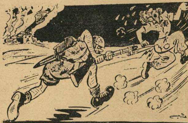
« امر مجلس الأمن بوقف القتال » الجهوني — أف أف أزي .. هو أنا أقر أف ! „כך נסדק את הציונים!"

[ تعارض حمله الاسم المتحدة في الحساب قوات الصهيونيين ال قواعدها قبل المدينة ]