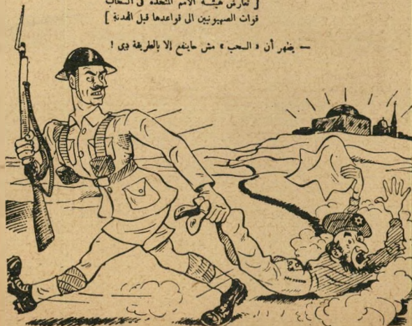
„אין דרך אחרת!"

— يظهر أن « الحلب » من حايض إلا بالطريقة دي !