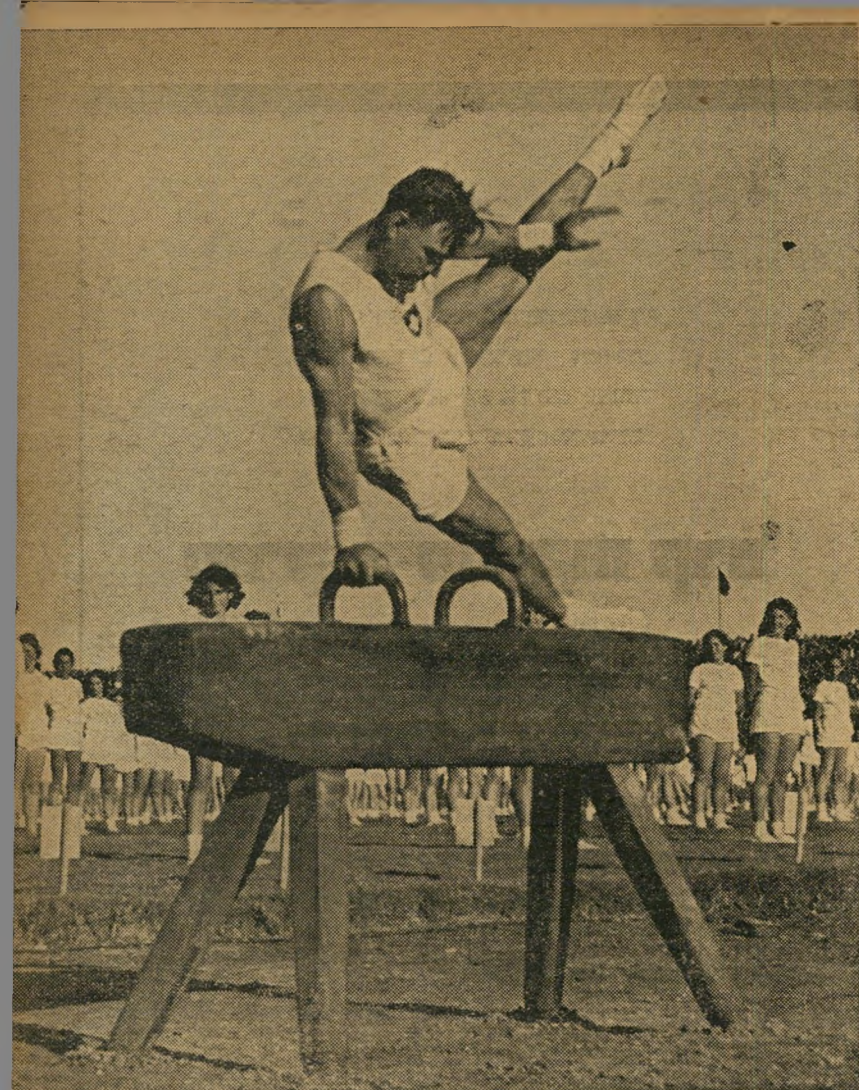
מתעמל-אורה משוייץ מרגים תרגילי התעמדות מרתקים על סופ-העץ

שלמה לא הרבה להתמהמה, אחר שיצא מהמטבח, נפרד מחנה ויצא את הבית. משה לא שיווה חשיבות רבה (2000 לירות) למה