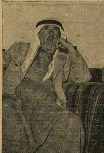
מתווך מושלמי שייך סאלח פדים מי לקח את הסכין?

הילד הגיע אל אביו שהתייצב מול הצופים, הוציא מידם את השבריינה, פקד עליהם להסתלק. הם נעלמו. כעבור רגעים מספר התפרצה באותה דרך חבורה של כ-150 עד 200 צופים, מזויינת במקלות, אבנים, פגיונות וגרזנים. כשירדו במדרגות והגיעו לרחוב ראו אדם