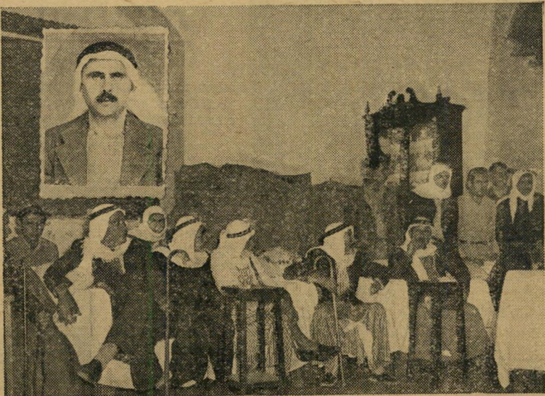
הנרצה אל-קאסם ושיבת האבן של בני משפחתו... האם אנחנו קומוניסטים?

בשעת התהלוכה זרק נער ערבי אבן בצד פים שלי. היה זה תכסיס כדי למשוך את הצופים למארב שהוכן להם על-ידי הקומוניסטים. אחד הצופים נפל לפה, הוכה ונעלם. או פשטה השמועה שהצופה נהרג. חבריו הבוגרים יצאו לחפש אותו, הגיעו עד לשכונת נה המוסלמית. הם הגיעו לאותו בית הפנה, הידוע לנו כבית קומוניסטי. התנפלו עליהם באבנים שבלי ספק הוכנו מראש על הגוון-טראות, שלושה או ארבעה צופים נפצעו.