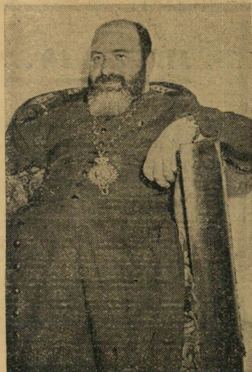
מתווך נוצרי מוטראן חכים מה קרה באמת?

מה קרה באמת? שליחי העולם הזה חקרו כתריסר צעירים מוסלמים, שטענו כי היו עדי ראיה למעשים.