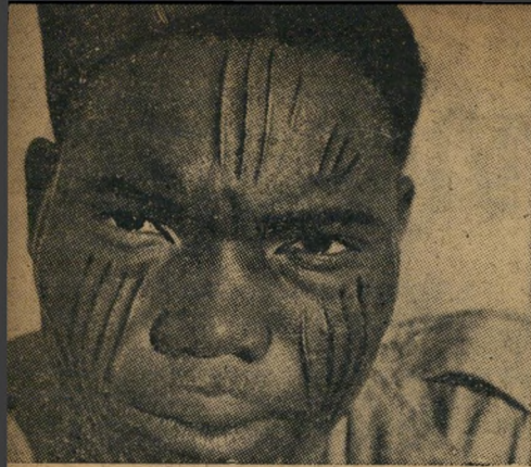
חייל אפריקאי שהובא מחוף-הזהב