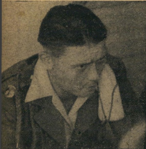
חייל גרמני שהתגייס לנגיון הזרים