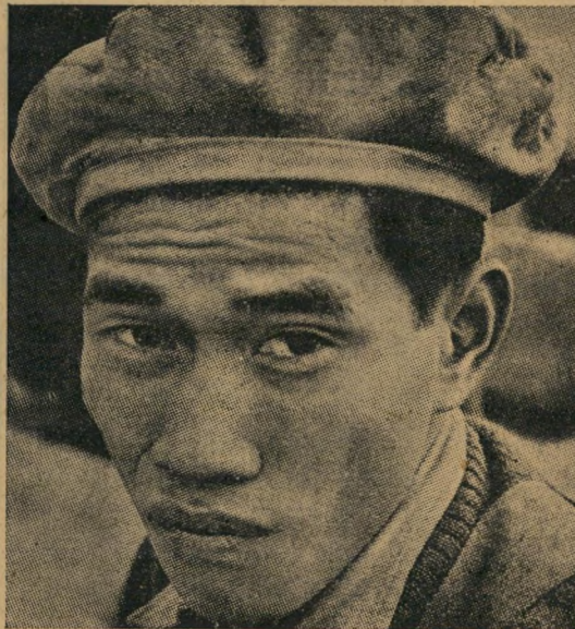
חייל ויאט-נאמו שעבר דקומוניסטים

ידי לקבל את כניעת היפאנים, והוסכם שלפי שעה ייכנסו האנגלים בדרום והסינים בצפון. האנגלים והסינים הגיעו כמה שבועות אחר הכניעה. משך שבועות אלה קרה משהו גדול. בפעם הראשונה מזה מאה שנה היתה ויאט-נאם ארץ חופשית לחלוטין. היא בחרה בממשלה עצ" לא היה פופולרי, עקב העובדה ששיתף פעולה עם הצרפתים והיפאנים, הוכרז להתפטר, נתמנה כאורח פשוט ליועץ הממשלה, שפרסמה את מגי" לת עצמאותה (אשר מילותיה הראשונות הועתקו ממגילת העצמאות האמריקאית: "כל בני האדם זכאים לזכויות חיים, חירות וחייבים להן"). בארדאי (התרגום המילולי: "שומר הגדולה") היה אחד הנתינים של נשיא הממשלה החדשה: הו צ'ימיין שעלה מן המחתר אליו ירד לפני 14 שנים.