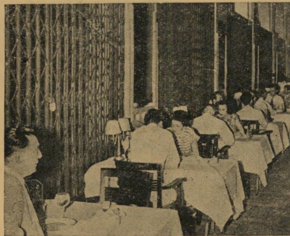
ארוחה וסריגים: גם במרכז סייגון אין בסחון — סריגים על החלונות מגינים על האוכלים הצרפתיים מפני רימוניידי אשר כל תושב עלול להטיל מן החוץ.