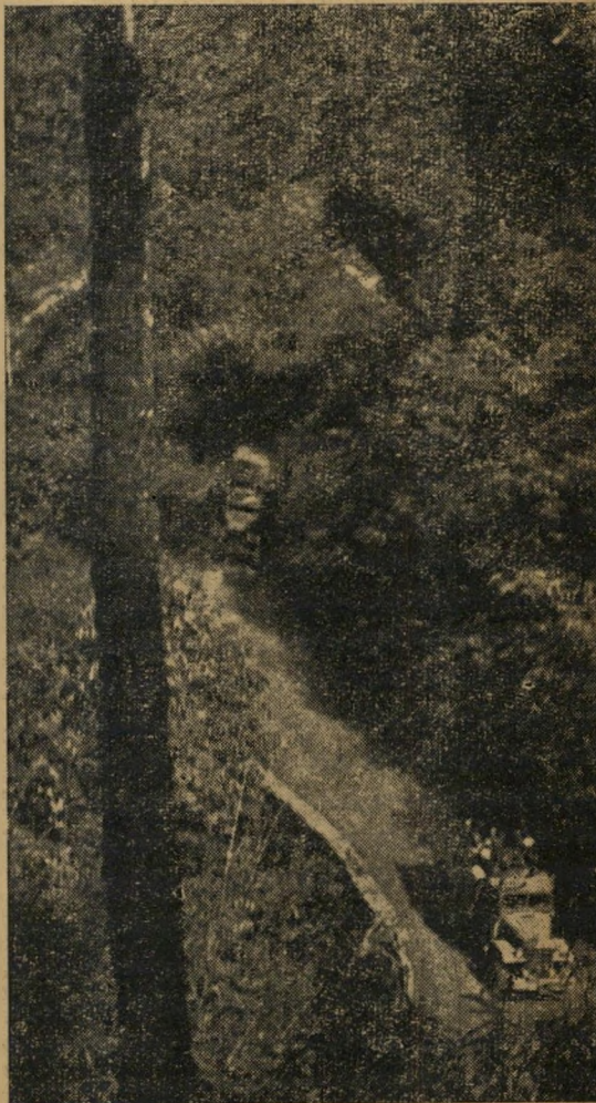
מוות בכבישים: משני הצדדים: חגיגות בייגונג: אנשי הו צ'י מיין, שיירה צרפתית עוברת לאחד המטעים.