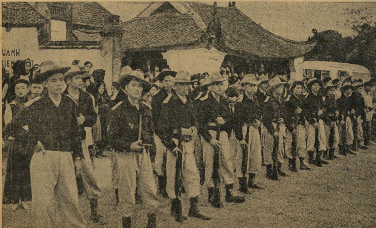
לוחמים מופקקים: רוב הצעירים בארץ אינם יודעים בדיוק עם מי ללחום. לוחמי גרילה אלה לחמכו־סורות הו צ'י מיין עד שנכחו לדעת שהוא קומוניסט מוחלט, עברו למחנה באו־דיי, אחרים התיאשו ממנו, ראו בו בובה זרה, עברו למחנהו של הו צ'י מיין.