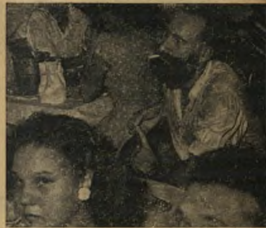
חיים במצור: משפחה של נוסעים צרפתיים, החיה במבצרה בכוננות מתמדת, שרידים אבודים של אימפריה הכורעת תחת מהלומות המהפכה הלאומית. מטעים רבים נעזבו ע"י בעליהם הצרפתיים ששבו לארצם.

אולם תקופת העצמאות של ויאט־נאם היו קצרות ומעטות. הסינים כבשו את הארץ בשנת 213 לפני ישו, החזיקו בה משך 1200 שנה. בני הארץ לחמו בהם משך מאות שנים, השתחררו או נכבשו שנית בידי הסינים. במאה ה־19 נפלה הארץ שלל בידי הצרפתים. הם השקיעו בה השקעות העולות ל־2000 מיליון דולאר, בנו כבישים, גשרים וסכרים, מוסדות מחקר רפואיים ואוניברסיטה, השקו שטחי אדמה ניכרים.