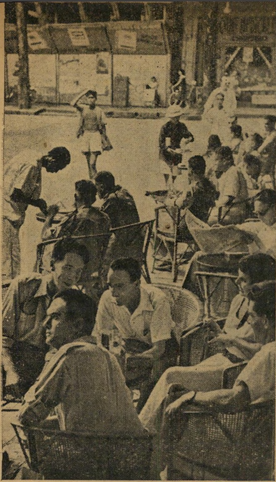
גיבורים בעורף: במלון קונטיננטל בסייגון, בירת הארץ המוחזקת בידי הצבא הצרפתי, מתנהלים החיים כרגיל, שופעת הרכילות — כמו בזמנים שלפני המלחמה,