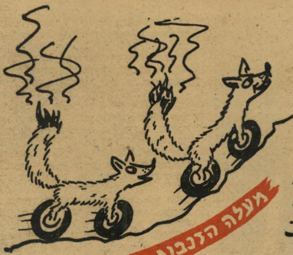
מעלה הנבואה הפוערים

כאשר הוחלט כי תחרות השנה תהיה תלאת, נקבעו כינויים מתאימים לקטעי המסלול. אולם הרשימה הגיעה לידו דוש והוא החליט לעבור את המסלול בעצמו - רכוב על גבי קריק"ט מורה של אוסנוץ. בעבור כמה ימים הניח לפני המארגנים את העמוד הזה בתביעה כי ישנו כמה מן הכינויים: "בחרתי לכם שמות יותר מתאימים" הוא הכריז, "אפשר לצייר אותם!"