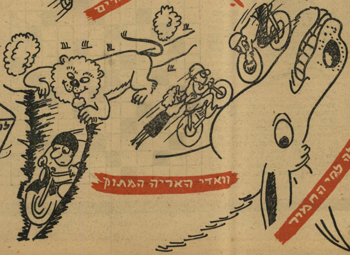
וואדי האריה המרוץ