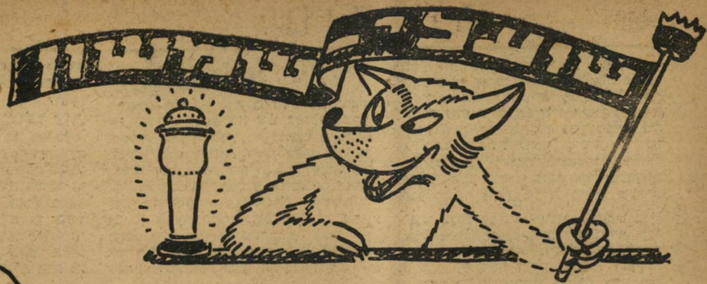
תלאותיו של מסלול

כאשר הוחלט כי תחרות השנה תהיה תלאת, נקבעו כינויים מתאימים לקטעי המסלול. אולם הרשימה הגיעה לידו דוש והוא החליט לעבור את המסלול בעצמו - רכוב על גבי קריק"ט מורה של אוסנוץ. בעבור כמה ימים הניח לפני המארגנים את העמוד הזה בתביעה כי ישנו כמה מן הכינויים: "בחרתי לכם שמות יותר מתאימים" הוא הכריז, "אפשר לצייר אותם!"