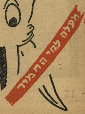
מעלה למה המרוץ