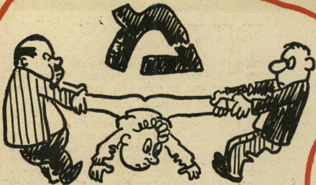
הצטרפת למפיש. אוי ואבוי, יש פרוד. לרוץ פעמים הנריקה, הראשונה קדימה, הסניה - אחורה!