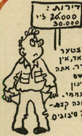
לצטער מאד, אין חדר. אתה נושם לשיכון העומי. חכה קצת - 3 סיבובים