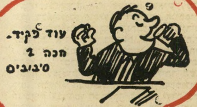
עוד לקיד. חכה 2 סיבובים