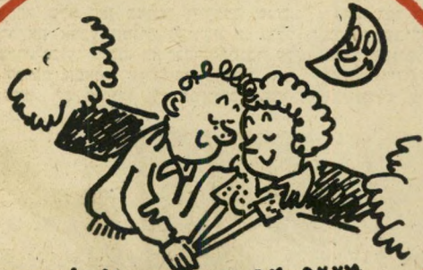
לצאת אג הבחורה של חלואותך. אגה בוקיע העביע. רוץ קדימה 3 נקודות