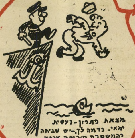
מצאת פתרון-נעסיא יגאי. נדמה לך-יש שבאה והמשטרה מורידה אותך חדרה לחוף. חזור 5 נקודות