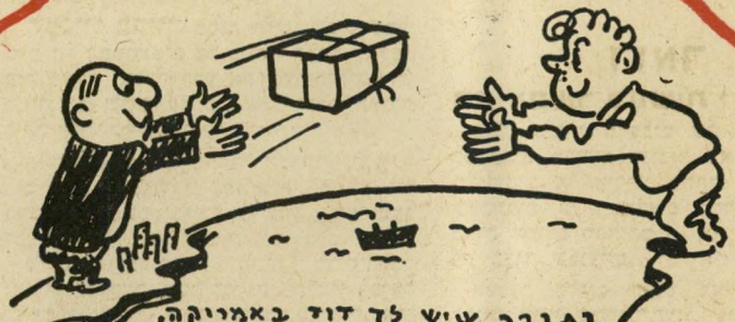
נבברר שיש לד דוד באמיוקה, והוא ישלח לד מבילוט. רוץ אהר 3 נקודות למשרד הדאר, אחרי ייעלס לד החצי.