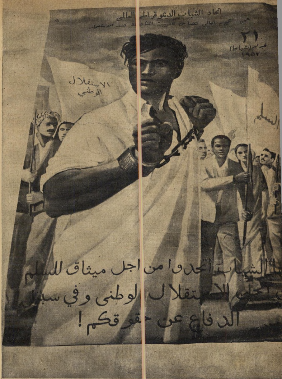
פלע המחלוקת א': כרזה זו של נגד אנגליה וצרפת. אנשי ליבשיץ (וגלילי) טוענים שלעת עתה הערבים הם אויבינו, וכי אין לשעבד את מדיניות ישראל למדיניות הסוביטית. לעומתם טוענים אנשי סנה: ליבשיץ שוביניסט.

סנה הצטרף למחנה הסובייטי ללא תנאי. בהגיון קר ותותך, הי אופייני לו, הסיק את כל המסקנות: תבע לשגר באיכוח ליר עידה בברלין הגרמנית, להכניס את ערביי מפ"ם למפלגה כחברים שוויוניות, לתמוך במלחמת החרור של עמי ערב, אחר שזכ תה בתמיכת הסובייטים. לעומת זאת ראו ליבשיץ וגלילי את מפ"ם אמנם ככתב-ברית למחנה הסובייטי, אך ככת ברית הרשית אית וחייבת לעמוד על המקח, לשאת ולתת — בעיקר כדי להשיג ויתורים בשטח העלייה מברית-המועצות ומתן חופש לציוניות בארצות הדימוקרטיה העממית. בשטח הערבי לא נבדלו בהרבה מעמדת בן-גוריון: ראו בערבים, וגם בערבים הלאומיים והמתקדמים, אויבים של ישראל. לפיכך התנגדו להכנסת הערבים לשורות מפ"ם, דרשו להשאירם בחטיבה נפרדת.