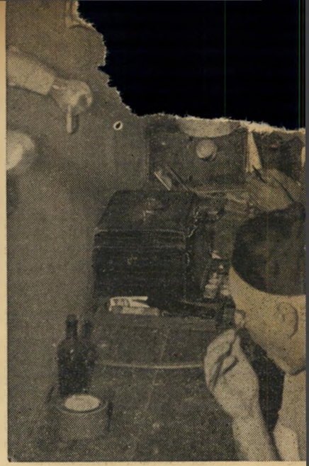
גבות בעזרת מכחול. אורה עידו המשחקת בתפקיד הגברת ונג, אשת שר'השרים, מנסה לשוות לפנייה מראה סיני ע"י גבות סיניות — קו צבע דקיק.