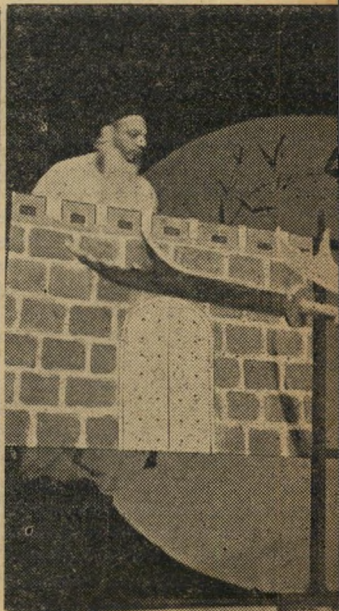
לרשע, הצלה מתלייה. לאחר שסייה חזר למולדתו, מכירה אותו אשתו בקושי רב, וכשמגיעים שניהם לחצר אביה, מעוררים את שמשי השחקנים, תובעים את עריפת ראשו של ויי הרשע. אולם ברגע האחרון מוטה הרע, הכל שמחים.