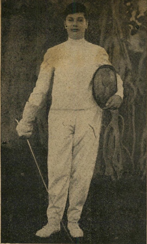
4. משה דיין — המלך פארוק יצחק שדה — קלרק גייבל