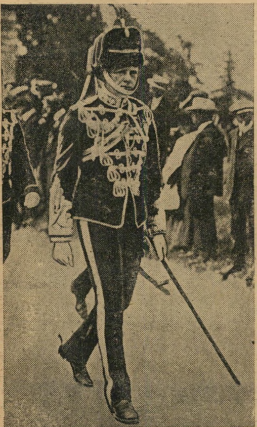
10. הארולד מאקימיכל — אניירן בוואן וינסטון צ'רצ'יל — דוכס וינדזור