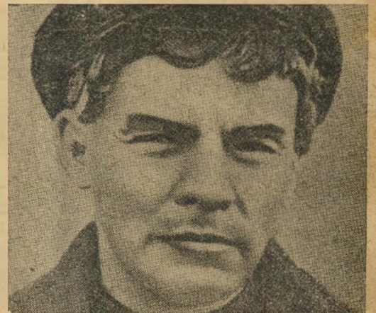
5. גורגי מלנקוב — ולאדימיר לנין מאו טסה'טונג — א. ד. גורדון

הזיהוי הסופי ייעשה בעזרת הכתרון, במסגרת התשבץ שבשמור 13 של גליון זה.