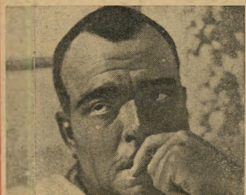
9. גיהרלאל נהרו — שולסן מארוקו לורנס אוליבייה — אורסטון וולס