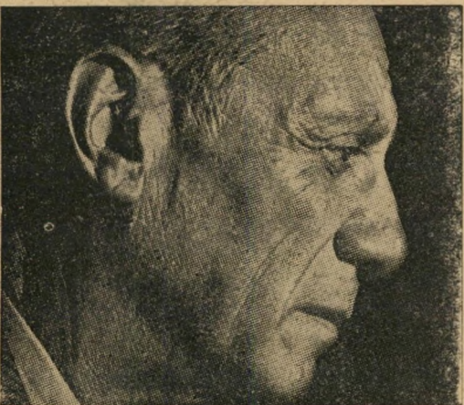
6. אריך פון שטרנהיים — אלברט איינשטיין פבלו פיקסו — רומן רולן