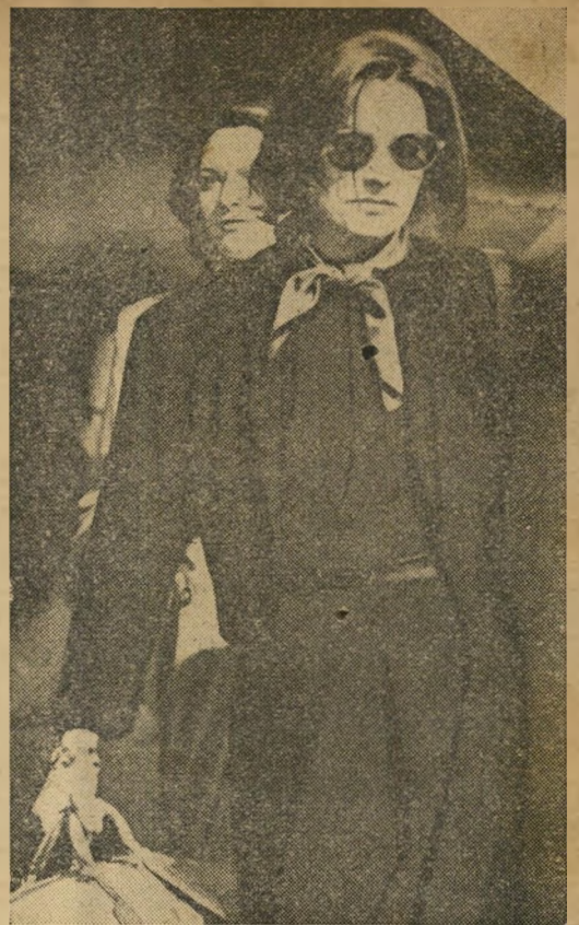
1. גרטה גרבו — אנה פאוקר אסתר וילנסקה — מרגרט סרומן