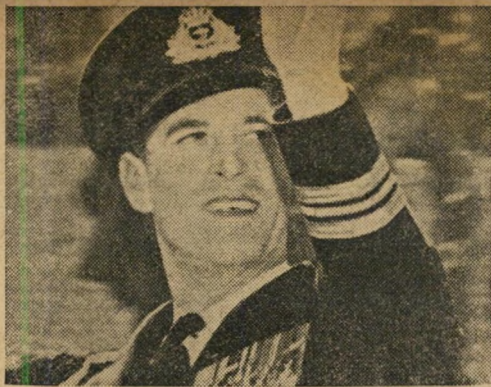
2. לורד מונטבטן — הנריק קרלסן מרדכי לימון — דוכס אדינבורג