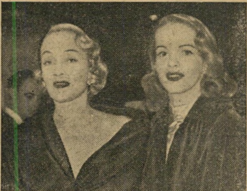
3. שתי אחיות פארוק — מרלן דיטריך ובתה שתי בנות בי. ג'י. — אשת ואחות שאח פרס