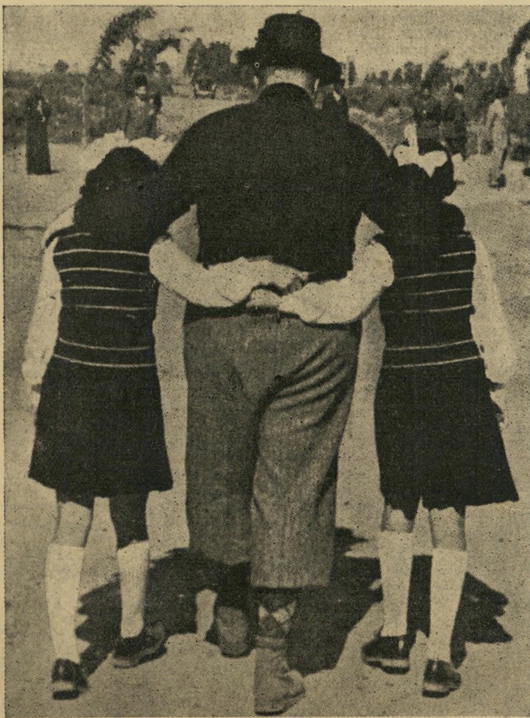
מדך פארוק (עם בנותיו פריאז ופאוזיה) סוף סוף, יורש

מאז תחילת המאורעות באיזור הסואץ חדלו גם החיילים האנגלים לבקר שם. כי רציף מ" חמד עלי הפך מרכז יחידות לוחמים מן החוץ וכנופיות של אספסוף שהתארגנו מכין תוש" בי הרובע המפוקפקים. כאשר שלושה חיילים אנגלים נכנסו לשם — בתום לבב או בשגגה — הוקפו המון סואן, הושארו ללא רוח חיים