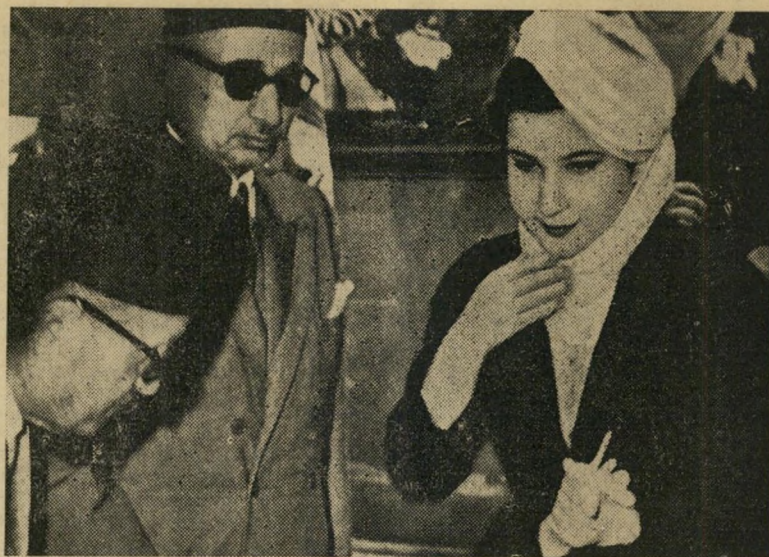
המלכה נרימאן 101 יריות תותח

בין כתלי בתיו הנמוכים. בעומק של שלושה רחובות מגדת התעלה היה הרובע מוטל תחת משטר צבאי קפדני ביותר, משמרות בריטיים חסמו את הכניסה לאיזור, לא נתנו לאיש ל" התקרב. בפנים הרובע עברו חוליות חיילים מבית לבית, בוקו תעודות, חיפשו נשק. כל אדם שנראה כמשכיל נדרש להצדיק את נוכחותו במקום. האנגלים חיפשו בעיקר סטודנטים שכאו מחוץ לאיזור. גמרנו אומר לחסל את הטרוריסטים, הכריז דובר אנגלי, "ולשם כך נשתמש בכל האמצעים העומדים לרשותנו!"