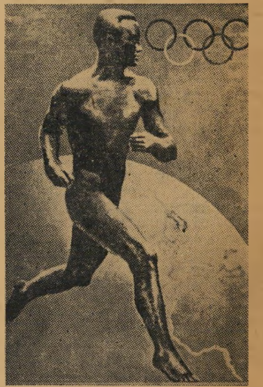
שלט אולימפיאדת הלסינקי