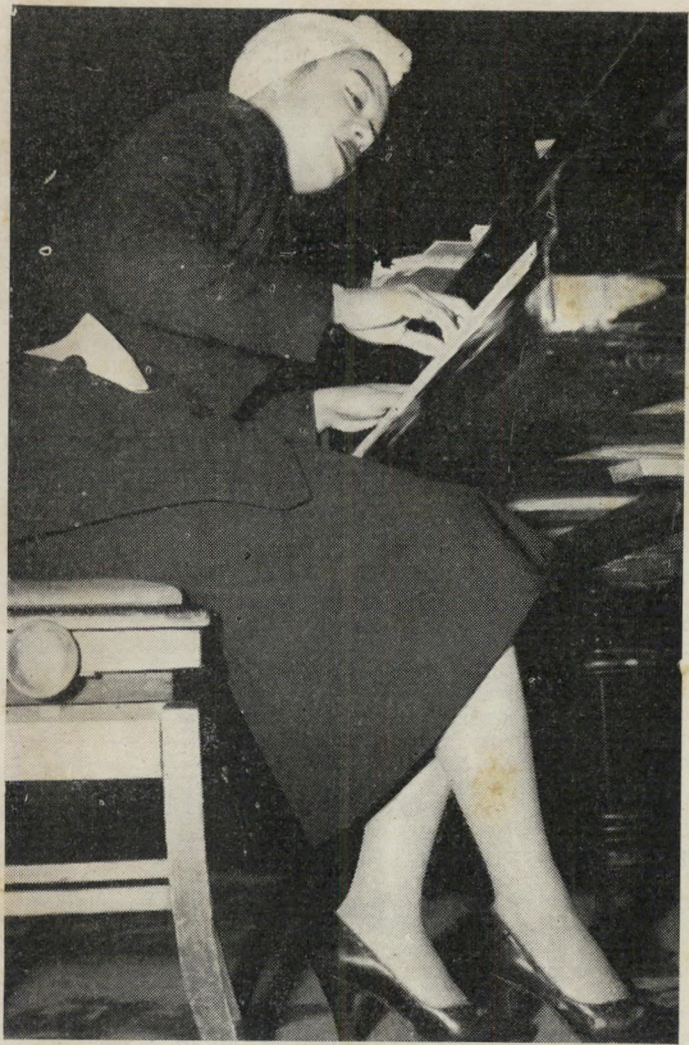
... דרך שופן ...