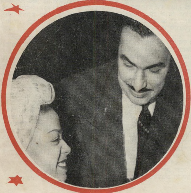
לבעל. צ'ר קונגרם.