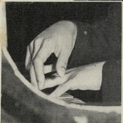
... ומקצב הדרום ...