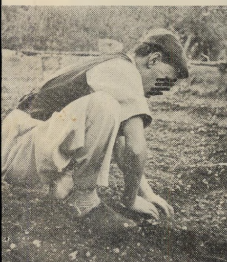
המחלה בשלביה הראשונים מתגלה המחלה בצורת קוים ורודים שמופיעים בחלקי הגוף השונים. מאז שגילה הנסן הנורבגי את חיידק המחלה והצליח לבודדו, החלו אנשי מדע בכל רחבי העולם במחקר מקיף לשכלול