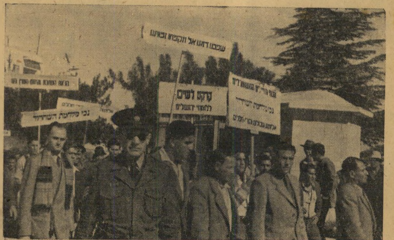
הפגנת הנכים בירושלים

שני צופרי אועקה צפרו בחשכת הלילה משני כיוונים. המכונית היחידה של מכבי האש, תחנת רחוב מואה, היתה בדרכה ל-רחוב 145 ביפו. אותה שעה, 12:45, לאחר חצות, לחץ נהג המכונית השניה שיצאה מ-התחנה המרכזית של מכבי-אש ברחוב ח-על דושת הדלק במטרה להגיע לאותו המ-