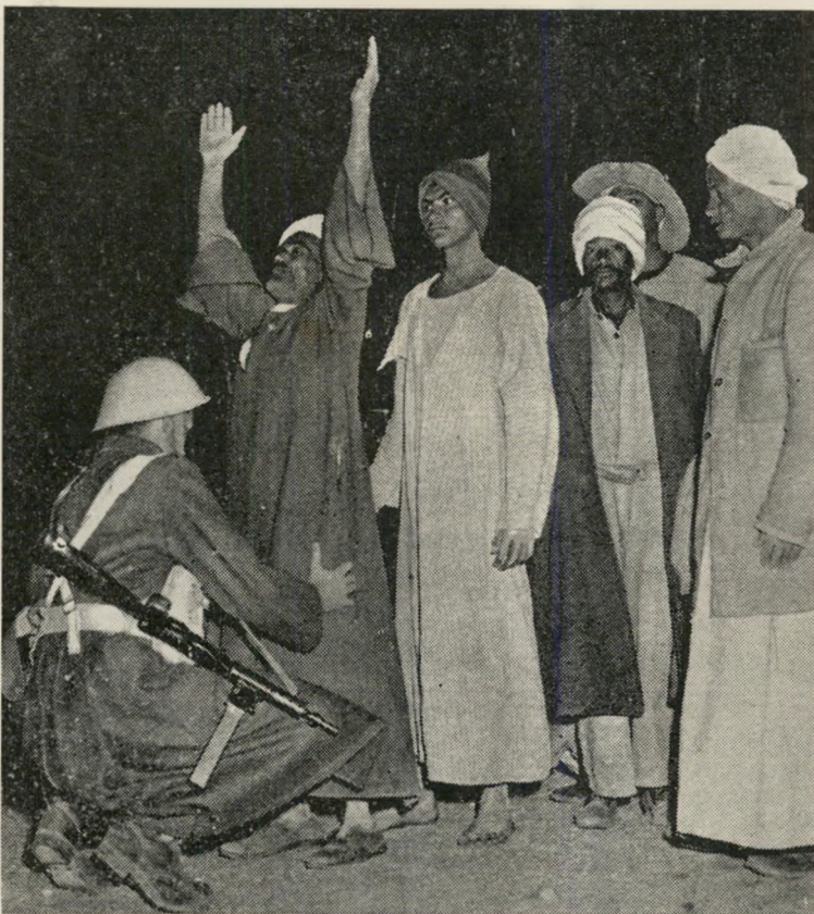
טריפוליט. כמה יריות נורו על מכונית בריטית במבואות איסמעיליה. החיילים עוצרים את כל הנמצאים בסביבה, עורכים חיפוש קפדני אצלם. שיטה זו טרם גילתה נשק רב או טרוריסטים, אך הצליחה להטריד. תקוות האנגלים: לעורר התמרמרות נגד הלוחמים.

היחסים בין הנציג המצרי ואל-סנוסי החריפו והלכו, הגיעו לשיא כאשר עוב הנציג המצרי את ישיבת הועדה הבנלא"מית, חזר להתייצגות דחופה עם ממשלתו בקהיר בהכריזו כי ממשלת לוב אינה אלא בובה בידי האנגלים. "כל זמן שלא תשנה הממשלה את יחסה לשלטונות ה"כיבוש הזרים," הוא הודיע במסיבת ע"ינאים בקהיר, "ספק אם תתקבל כתברה