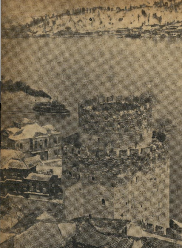
נושא החיכוכים. מגדל זה נבנה בשנת 1452 על ידי התורכים להגן על מעבר הדרזוניים בנקודתו הצרה ביותר. מעבר זה היה משך מאות שנים נושא חיכוכים עם רוסיה.

היחסים בין השולטן והגנרל האמריקאי, הלכו והת' הדקו. הגנרל הזמינו למסיבת-הגמול. כשנוכח לדעת כי ה' שולטן אינו יכול לבקר כל אדם בתחומי ארצו, הזמינו לסייר באנית-קרב אמריקאית. השולטן קיבל את ההזמנה,