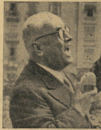
מאל נולד למשפחת אכ' ננס לבית ספר צבאי, שם שנשלח להמשיך את לימודיו. שם בא במגע עם חוג חסן (מולדת). יחד עם תפס גם מקום מרכזי בלידה של המדינה המתפוררת. שיפה הלאומית העליונה, פובליקה ועליו כניסיה.

היה זה פרס שהתורכים רצו בו ביותר. הם האמינו כי כניסתם לברית זו — למרות היותם כה רחוקים מהאוקיינוס האטלנטי — תקנה, באופן חותך, מעמד של מעצמה מערבית לארצם, תסגור לחלוטין את פרק ההיסטוריה המזרחי של תורכיה. אולם כניסתה של תורכיה לאמנה הצפון אטלנטית לא סיימה את הויכוח על מקימה במערכת ההגנה המערבית. טענו הבריטים: תורכיה היא הארץ החזקה ביותר במרחב; אם תנותק ממנו תישלל המנהיגות מאיורו זה. גם הארץ החזקה השנייה, יש ראל, לא תמצא