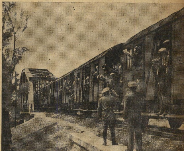
המוסלמים חוזרים הביתה. מאז קמה תורכיה החדשה דרמו אליה פליטים מארצות הבלקן השכנות. אחר המלחמה עם היוונים חזרו אליה המוסלמים שגרנו ביוון. לפני כשנה עזבו המוסלמים את בולגריה הקומוניסטית והגיעו — רכבות, רכבות — לתורכיה.