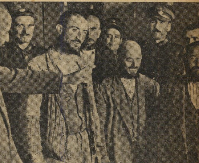
זקנים דתיים. אנשים אלה שייכים לכת המוסלמית הקנאית של הטיגיאנים אשר, כאות מייחודה, מגדלים זקן. מאז עלתה ממשלתו הליברלית של ג'אלל ביאר, חזרה גם השפעת הדתיים שדוכאו על ידי משטרו הקומוניסטי למחצה של כמאל אתאטורק אשר שנה אותם.