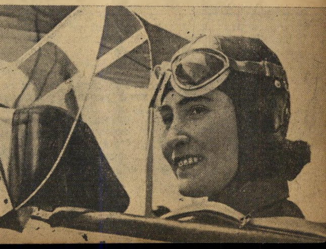
כמו הנוער. תמונת כזו של הטייטת הצעירה התנוססו בכל הוצאות התעמולה בתורכיה כסמל המהפכה שחלה במדינה. מידת הקידמה שפתיחה בפני הנוער התורכי את כל השערים — ללא הבדל מין. אחת הטייסות המפורסמות ביותר היא בתו החזרנית של אינונו.

גם "עלייתה על הרכבת ברגע האחרון לא תשנה את פני הדברים", הריע. לכן כאשר, בשנת 1946, תבעה ברית-המועצות את שניו הסכם מונטרה משנת 1936, המוסר לידי תורכיה וכותייה להחזקת מיצר הדודגלים נטו מעצמות המערב לתמוך בר"סיה. אולם תורכיה נקטה בעמדה תקיפה ביותר, סירבה להסכים לכל שינוי במעמד אזור אסטרטגי זה. מעמדה היה גם חזק מאוד, מאחר שהיתה הארץ הגדולה היחידה שלא הסתכבה במלחמה ההורסת.