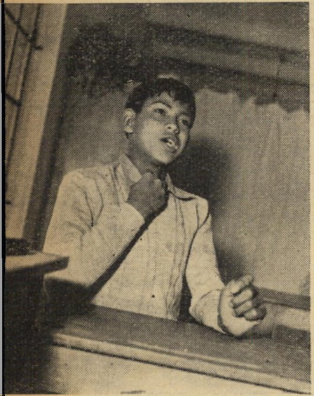
רעבה ביותר. גם הרועה ישב...