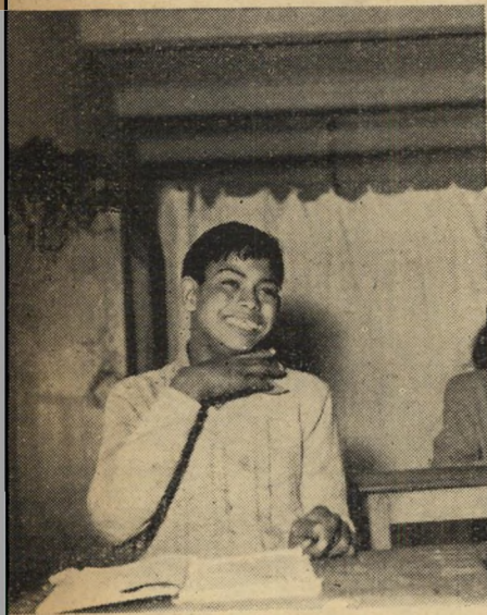
ביתהספר . הוא נשך לתוך...