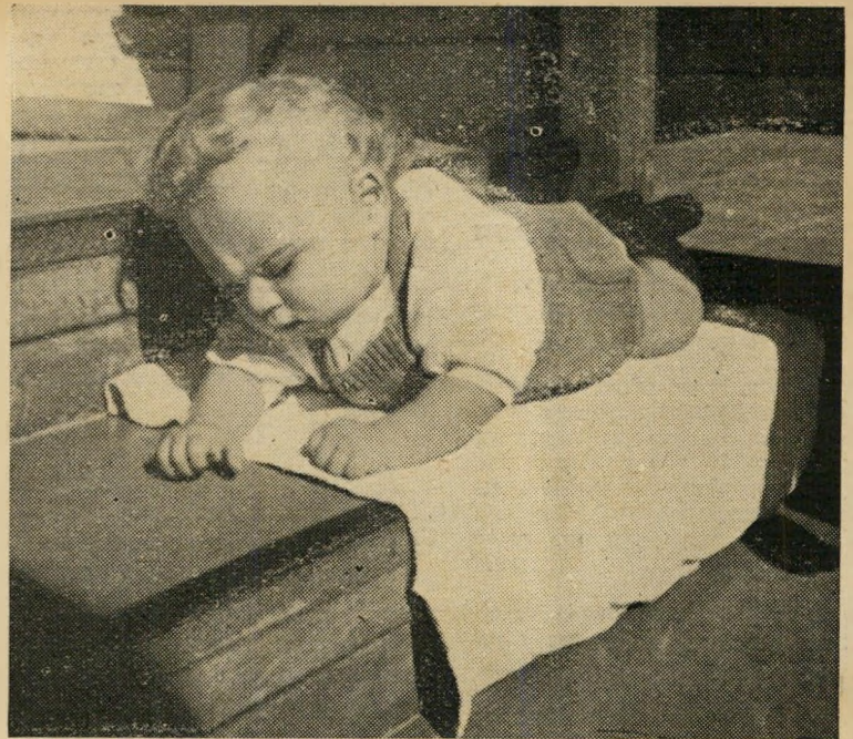
היכן האם? תינוק בן שמונה חודשים נמצא עזוב על מפתן הקומה הראשונה ברחוב ריינס 32, תל-אביב. הוא נמסר על ידי המשטרה למוסד לטיפול באם ובילד של ויצ"ו. עד שתופיע אמו לבקשהו חזרה — אם תופיע. אולם הדברים האלה אינם מובנים לילד.

בינתיים בוטלה תכנית ההסרטה. דהימיל ר' לרטים אחרים ומיצ'ור החליט לה' הפסדה בדרך הקשה, אך המקור' בלתי יותר; וכנס לבית-ספר דרמטי בעיר סמוכה להוליווד ורתם עצמו ללימודים הקשים. המפיק האל רוץ' ראה את השחקן הצעיר באחת מהצגות המדרשה, קרא אותו להוליווד ולאחר תפקידים קטנים, מעשו רושם על הצופים, ביחוד ממין נקבה, היה לכוכב. לאחר שנים, כאשר ניגש דהימיל שוב