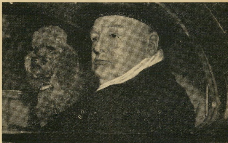
ראש הממשלה החוזר, וינסטון צ'רצ'יל, נוסב את המנוף...

הצבא האמריקאי והבריטי היה מוכן לפ"רוץ ללב גרמניה. בעוד חודש, חדשים, היה על המלחמה להסתיים. במטהו של אייזנהאור חיכו כנמה גנרלים לביקורו של וינסטון צ'רצ'יל. בנגוד למקובל הופיע במדי קולונל של הצבא, במקום במדי חיל-האוויר, הוציא מכיסו גרתיק של עור שהכיל סיגארים בני