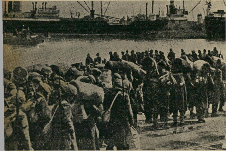
השרידים יוצאים: הכיתות האחרונות של 84,000 החיילים הבריטיים עולים על אניותיהם, בהשאירט מאחוריהם את השאלה: מה היה מקומם האמיתי של אצ"ל ולח"י בהתפתחות המאורעות שגרשה אותם?