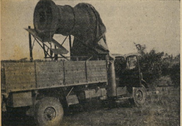
פצצת-החבית: ההמצאה הפשוטה שאיפשרה להעפיל גליל מלא חומר נפץ מעבר לגדרות שהקיפו את הבנינים הבריטיים. היא הובאה בגלוג, שמה ללעג את אמצעי הזהירות.