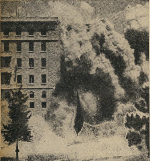
מזון המוקד דויד: המעשה שגרם להאשמות ההדדיות החריפות ביותר בין שותפי „תנועת המרי“ בימים ההם.

בהגנה ה„ימנית“ לא היו הריביוניסטים אלא אחד השותפים. המפקדים הראשיים היו, בדרך כלל, אזרי חים מתונים יותר. הריביוניסטים הקיצוניים יותר מסוגו של ד"ר אבא אקמאיר, טיפוס רוסי אינטלקטואלי וממושקף, שהיו מושפעים על-ידי שירי המי שחיות המזוינת של אורי צבי גרינברג, לא מצאו סיפוק בהגנה זו, השתעשעו בחוגי „בריונים“ או „סיקרטיים“ (על שם הקנאים הקיצוניים שגרמו למלחמת האזרחים בירושלים הנצורה בימי טיטוס), ש ערכם הצבאי היה אפס. אולם כשנרצח חיים ארלוזורוב, הכוכב העולה בשמי מפא"י, ופינה את דרכו לדיד בין-גוריון (עד אז דמות ידועה אך במעט),