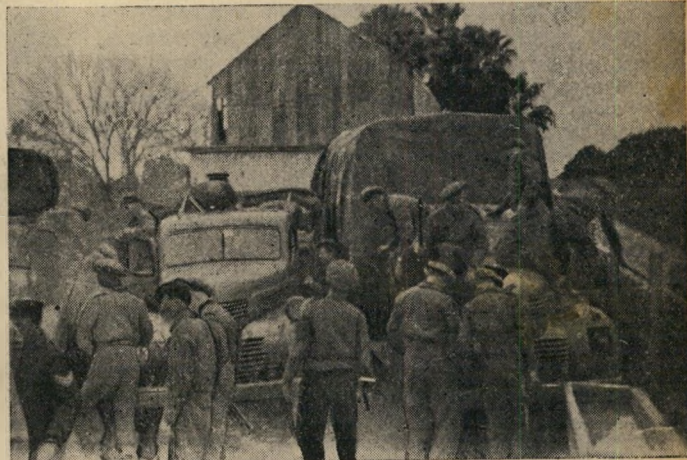
המבצעים: אנשי אצ"ל, במדי חיילי הדיביזיה המוטטת הבריטית, לפני צאתם להתקפה נועזה על מחנה סרפנד המבוצר מכל הצדדים.