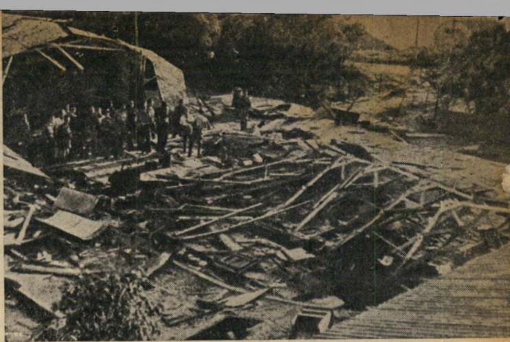
מיבצע נועז: מחטן נשק הרוס במחנה הצבאי הבריטי בסרפנד. על אף כל אמצעי הזהירות הצליחו אנשי המחתרת לחדור לתוך מחנות הצבא.