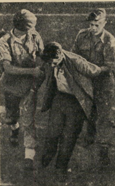
ההעפלה: מעפיל אלמוני מועבר לאנית הגירוש. ההעפלה, בה החלו אנשי האצ"ל לפני המלחמה בניגוד לרצון המוסדות, הפכה רימי המלחמה ואחיה לנשק העיקרי של ההגנה וגרמה יותר מכל פעולה אחרת לעירור עור האהדה הבינלאומית לממשלה הבריטית.