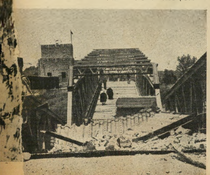
ההגנה פועלת: גשר אלנבי שפוצץ ע"י ההגנה בפעולות המרי.