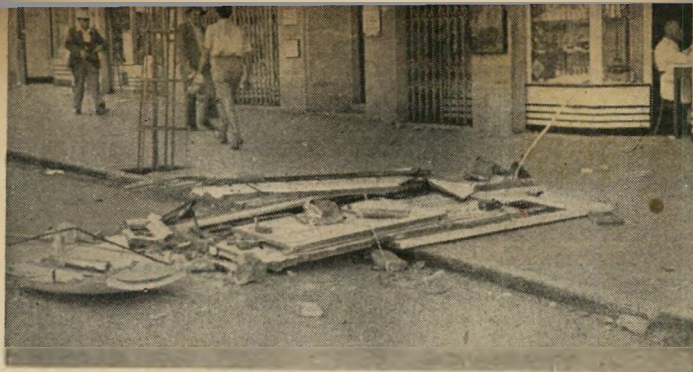
הפעולה הראשונה נגד הממשלה: פיצוץ תאי הטלפונים בתל' אביב היתה הפעולה הראשונה המכוונת נגד הממשלה הבריטית עצמה.

כל צעיר שבדל בארץ היה קשור במלחמת ה' מחתרת, אם לחיוב ואם לשלילה. אלפים היו חברי אצ"ל ולח"י כשליבתם האחרונים, אלפים אחרים עברו דרכם במרוצת השנים, התגייסו