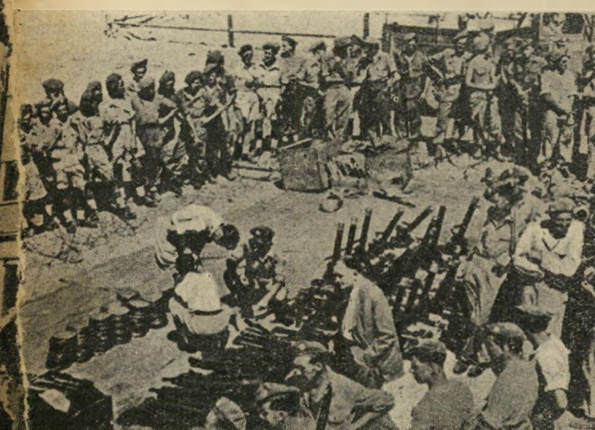
ההגנה סובלת: מחסן הנשק הגדול שנתגלה ביגור, באשמת מלשין שנאסר אחר' ע"י ההגנה, שוחרר תמורת שחרור אנשיה.

הזרוע המזויינת, איך שהוא. הצעדים הראשונים היו שקטים למדי. בארץ היה קיים ארגון של הגנה עצמית. תפקידו היה אחד ויחיד: לשמור על חיי הישוב ורכושו מפני התקפות ערביות. כיוון שהיה ברור כמעט לכל בני הישוב כי פקידים בריטיים רבים נוטים חס' לתנועה ה' לאומית הערבית, בהתאם למסורת שהקולונל ט. אי. לורנס המפורסם הפך אותה לרומנטית, נראה זר ישנים, רובים ארדנים, רימוניידי פולניים שהיו המשתרה הבריטית. לאגור נשק סודי בישובים העבריים כמיוות הנשק היו, לרוב, כמעט מנוח' כות לפי המושגים של היום: כמה אקדחי מאר' זר ישנים, רובים ארדנים, רימוניידי פולניים שהיו מסוכנים יותר למשתמשים בהם מאשר לאויביהם.