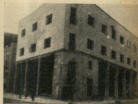
המשטרה המופצצת: בנין מפקדת ה' בולשח הבריטית במחוז ירושלים (ברחוב ממילא) שהובקע על-ידי אצ"ל בשנת 1944.

"ר"ק כ"ד": הכרוז בו איים אצ"ל במעשי תגמול אם ימנעו הבריטים בעד תקיעת שופר ליד הכותל המערבי - אחת הפעולות הבלתי-חוקיות המסורתיות של ביתר ואצ"ל.