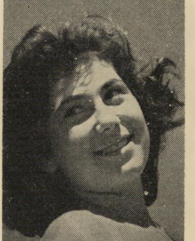
הארץ פפו. ירושלים