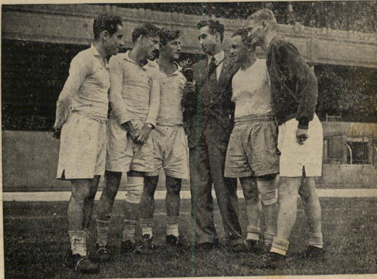
פרשן המדור העברי של הכי.בי.סי. מראיין את הפועל תיא' • עד שפנו לכיסו

הצרפתים פתחו בתנופה והתחילו קולעים לסל ללא להטוטים מיוחדים. הם שינו את שיטת משחקם מאיזרית לאישית לפי רמו