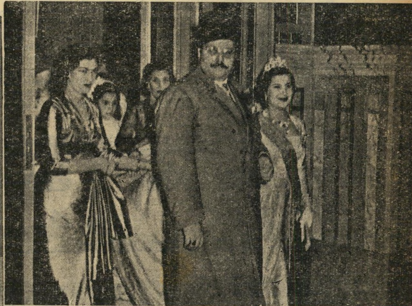
העושר והעוני. למעלה יושבים שמונה האחוזים השולטים על המדינה — המלך, הבאשים וקציני הצבא — כאשר כל מרצם נתון לרדיפה אחרי תענוגות ומינוי מיליוני שאיפות יתר 92 האחוזים של האוכלוסייה. הפלחים המרודים, אכולי המחלות

עם תום המלחמה, תבע זגלול עצמאות מדינית לארצו, ביקש לנסוע לועידת השלום בפאריס. במקום זה הועלה על אנית מלחמה בריטית, הוגלה לראשונה למלטה ומשם לאיי סיישל באוקיינוס ההודי. היה זה סימן לסערה לפרוץ. „ראו“, צעקו נואמים נלהבים ברחובות הערים ובככרות הכפרים, „האנגלי אינו שומר הבטחותיו, נלחמנו עמו נגד התורכים, אחינו לדת, ועתה הוא מסרב לצאת מארצנו. חוסיין ופיצל, שכנינו הערבים, מיסדים ממלכות חדשות ואילו אנו נשארו ככלבים. עוד מעט יפסיקו את המים בחרטום וסכריהם ימיתו