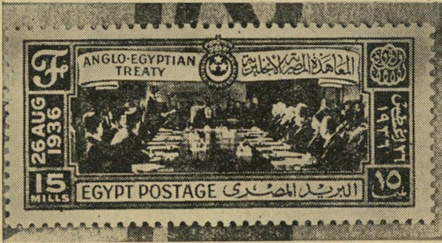
בול זו, שהוצא על-ידי הדואר המצרי לכבוד חתימת חוזה 1936 הוא הראשון (והאחרון) הנושא דמות כופר טמא (אנטוני איז'ק, ראש המשלחת הבריטית).

כל הלוואה שהוצעה, נתקבלה. אולם דעתן של המעצמות המערביות לא נחה עליהן מחשש שמצרים, תחת הפרעה החדש ובנו המוכשר, תפרוץ שוב את גבולותיה ותשתלט על הארצות סביבה. כל זמן שמוחמד עלי הסתפק בכיבוש סודאן ואיחודו לעמק התחתון, לא התערב איש — הבינו שזהו שטח מחייתה של מצרים. אולם כאשר התפתחה סכנת התערבות מצרית בדרכי התחבורה והשוקים שלהם בסהר הפורה הכריחו את השולטן (ששמו להודמנות) לבטל את הכרתו בכיבושי מוחמד עלי ולהשאיר לו רק את מצרים (עם זכות ירושה למשפחתו). אחרי מוחמד עלי עלה לשלטון עבאס באשא שנרצח כעבור שש שנים ע"י מתנקמים