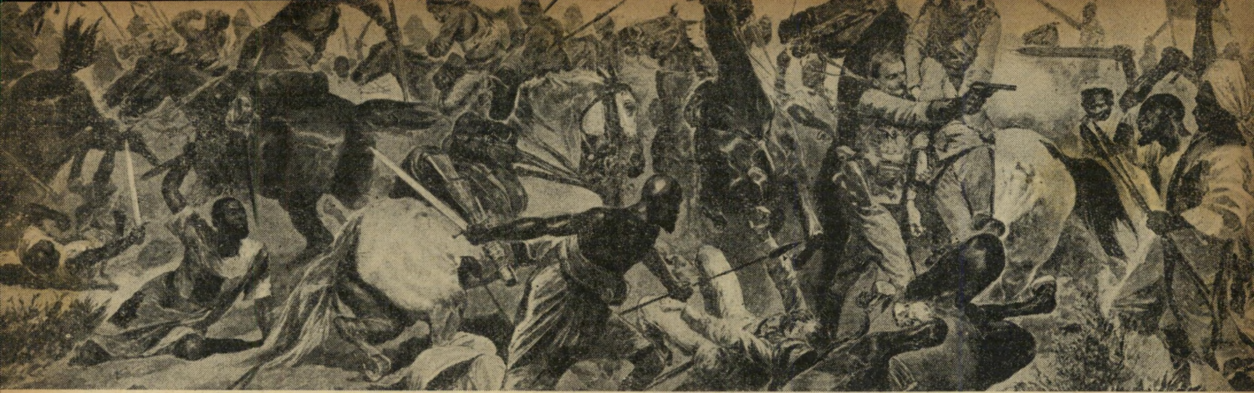
כיבוש הסודאן. לאחר שהסודאן נכבש בידי צבאות מוחמד עלי, קם מנהיג דתי בסודאן שכונה את עצמו "אלמהדי" והתמרד בירישי הבאשא המצרי הגדול. הסודאנים התקיפו את חרוטום הבירה, רצחו את הגנרל גורדון, שבא לסודאן בראש כוח בריטי ללחום בסחר העבדים. כתגובה שלחו האנגלים צבא שהתקיף, יחד עם כוח מצרי, את אנשי אלמהדי והשמידם בקרב.