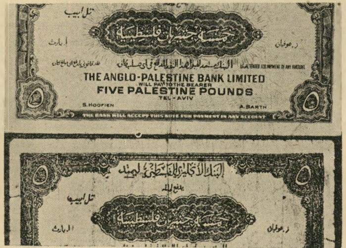
מלבד ההבדלים בצבע וכתיב הנור, המתגלים בשעת בדיקה קפדנית, יש גם הבדל של כמה מילימטרים בגודל השטרות.

לו להתפרנס חדשים מספר מטר חמש הלי-רות שהיה נתון בכל ספר קוראן.