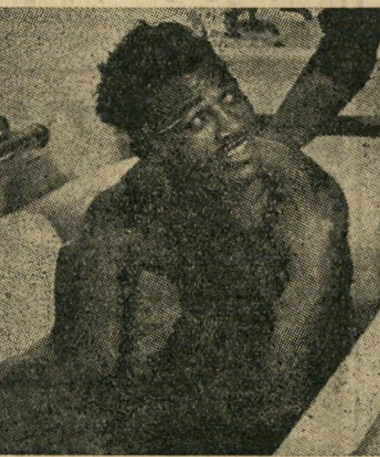
שוגר ריי רובינזון הזקן היה בן 31

רובינזון הראה כי טרם נס ליחו, אבל-בנתחו את שיגאותיו, קבע: "ההפסקה הקי-טנה, העיכוב הקטן זהו גילי". אחר כמה-תחרויות נוספות בארצות-הברית, בהן יגן-על תוארו ובגישה נוספת עם טורפין, החליט-לנטוש את הזירה בשנה הבאה. משונה לי-מדי כי גם נגדי טורפין, בן 23, החליט לר-טוש את הזירה אף הוא. הכריז טורפין לפני-עתונאים: "אני מתכוון בצינינות. אארוז ב"ספטמבר 1952. לא איכפת לי כמה כסף אפ-סיד, איני רוצה לגמור שיכור-מכות או כל-מין שיכור אחר".