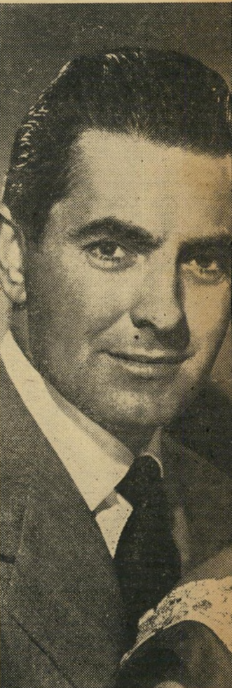
פסיון, אחרי נשואיהם

באטלר (ג'ון גארפילד), הוא רוכב ש בבושת פנים מכל מסלולי המרוץ ש שנחלץ ממנו במולדתו. אתו נמצא יו האמתי. הוא מצליח להרשם למרוץ וכלים מאיימת להרוג אותו אם סוסו ניגן בנו, ולאחר הנצחון נהרג בתאונה