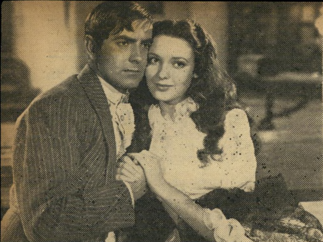
1941 : דם וחול -

היצירה המשמשת רקע לסרט כולו : סוגנת "אפסיונטה" לבסהובן, מת לאחר מכן כתוצאה מבליעת מנה יתרה של גולות.