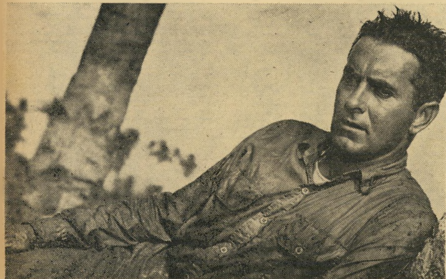
1950 : המחתרת הפיליפינית

היה זה בספטמבר. ג'וזף קוטן מתאהב בג'ון פונטיין כאיטליה הפכה מנסה - ללא הצלחה - לברוח מן המציאות, הכוללת את אשתו (ג'סיקה טנדי).