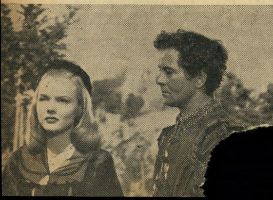
1950 : נמיך השועיים

נשיקות וגורלות. איבון דהקארלו בקומדיה צבעונית על אודות המערב הפרוע.