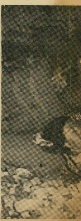
ה ברכיבה. הליל עדיין ארוך.

בכבישים המובילים חזרה לערים, נמוגה אוירת דליה. מכוניות דהרו בחשכה, מבלי שאחד הנהגים יטרח לעצור ולאסוף טרמפיסט. מכוניות שעמדו לצד הכביש, כשבצעליהן מחטטים במנוע, המשיכו לעמוד שם מבלי שאיש יעצור ויציע את עזרתו. המנוממים שקעו בהרגשה כי עתה חזרו לתנאים המקובלים, לעולם כפי שהוא בדרך כלל וכי מעתה רשאים הם לנהוג כפי שנהגו כל הזמן. עד אשר שוב יסעו לדליה, לכנס הריקודים הרביעי, בעוד שלוש שנים.