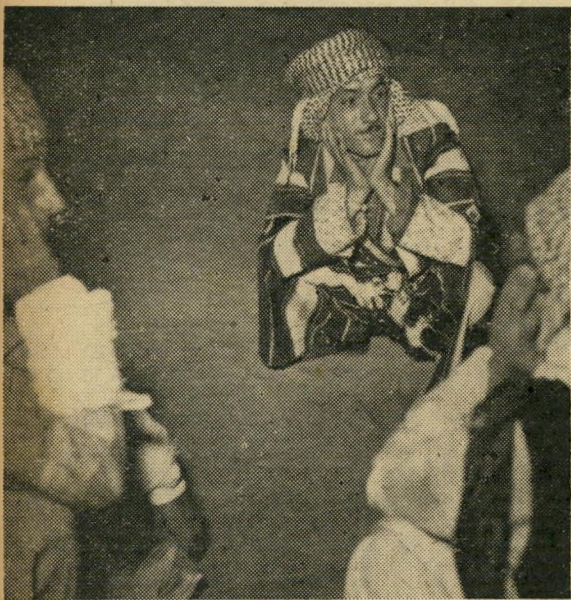
אני כוררי. גברים פראים אלה לא ראו מימיהם את הרי כור" דיסטאן, אשר הם מציגים הלילה את ריקודיו. כולם צברים טהורים, נולדו למשפחות כורדיות בירושלים. ריקוד זה נפתח בתמונה משפחתית, כשהנשים מבשלות אוכל ומגישות אותו לגברים היושבים מן הצד — הכל לצלילי הצרוד של חליל ערבי אשר מנגינתו החדגונית מודגשת על ידי חבטות בתוף גדול.