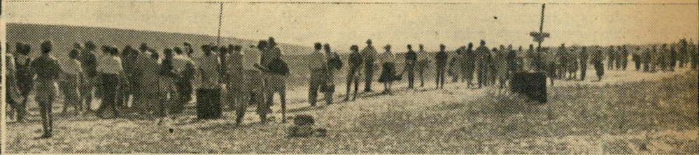
בוסעים והולכים. שדה סמוך הוקדש למגרש חנייה לאפלי המכוניות. מכל הסוגים והגדלים, שהביאו את רבבות המבקרים הנושאים שמיכות, אוכל ומזוודות, ה"הגירה" נמשכה מן הצהרים עד שעה וחצי אחרי התחלת התכנית.