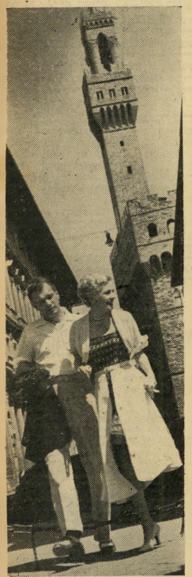
ג'ין פונטיין, ג'וזף קוטן המתים יודעים לחיות

רפורטגיה, הריהו מאמץ ראוי לציון: יש בו רעיונות מענינים. לדוגמה: מרוץ העצי' מאות מוכא בהשואה למרוץ עלית ההמונים, העליה לקרקע, מרוץ ההזוינות של צה"ל. מיפגן טאנקים — מול מסע מכוונות חקלאיות. ההסבר המילולי, שרבות בו ההברקות, נכתב בידי חיים חפר הצבר, אך הסרט אינו