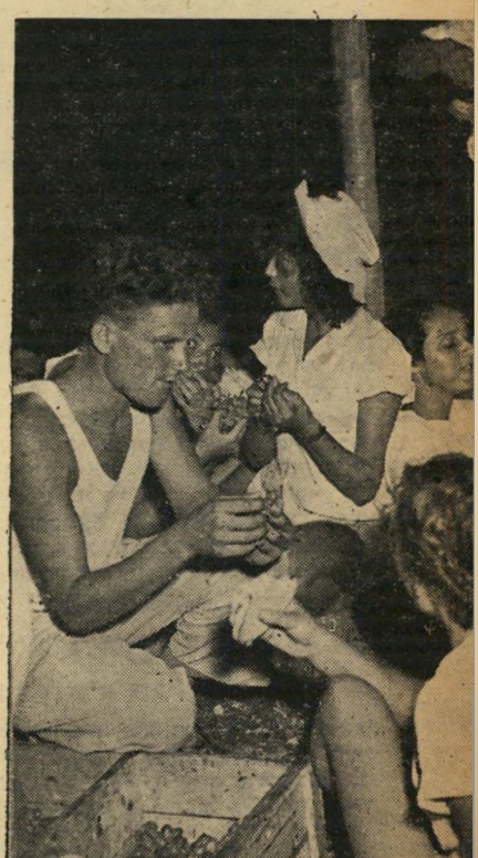
קבוצות באוהל ל האנשים מוזיעים