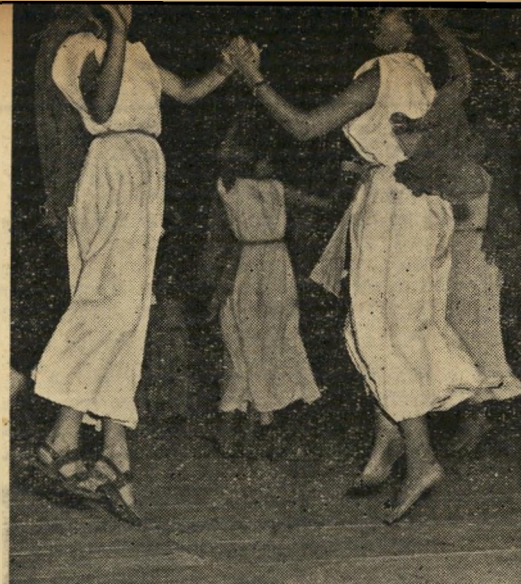
חזרה כללית על הבמה במקלחת, צווחת אימים

הקפטן הגרמני העיף בו מבט של בוז ואמר לו (לדברי גרונמן): "עמוד דום! אידיש הרבה יותר קלה מעברית! תרגם את החומר! הסתלק!"