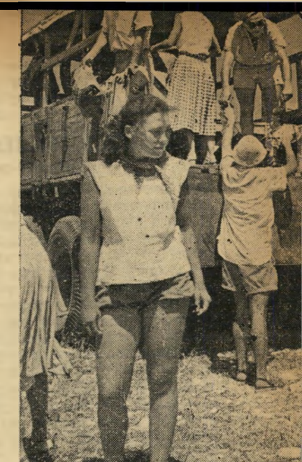
עם מיטותיהם בארם רוסי

אלא שדליה הפכה סמל לא רק לרוקדים שנהרו אליה. היא החלה מסמלת, קודם כל, דבר שרובבות מתענגעים אליו בסתר, "אני מצפצף על הריקודים", הודה בתור תל-אביבי מאנשי "נוער הזהב", שלבש הפעם בג" די חאקי ונדחק, מאושר, בין אנשי קיבוץ שופים. "אבל ה" הרגשה הו... כל כך הרבה גר" ער... אני מרגיש כאילו חוזתי לימי החייש, או לחטיבה... זה הערב הראשון מזה שלוש שנים שאני שוב מרגיש בבית!"