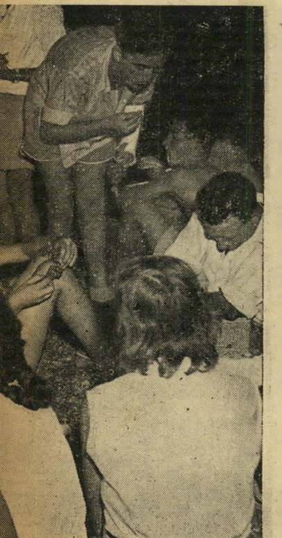
ארוחת או המסקר: