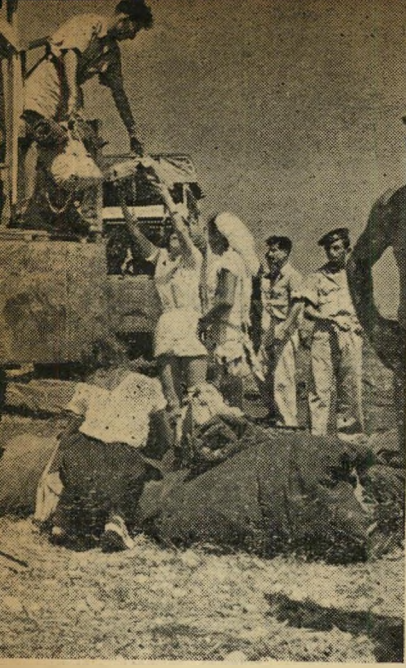
הרוקדים מגיעים להתחלה: