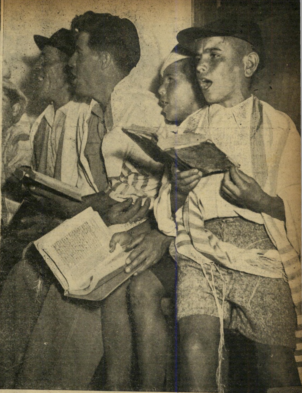
מושמאד: נערים וזכרים. בתפלה מתרכזים הזכרים משמאל, משמיעים את אחד מ'96 פזמוני מנדוצ'יו.