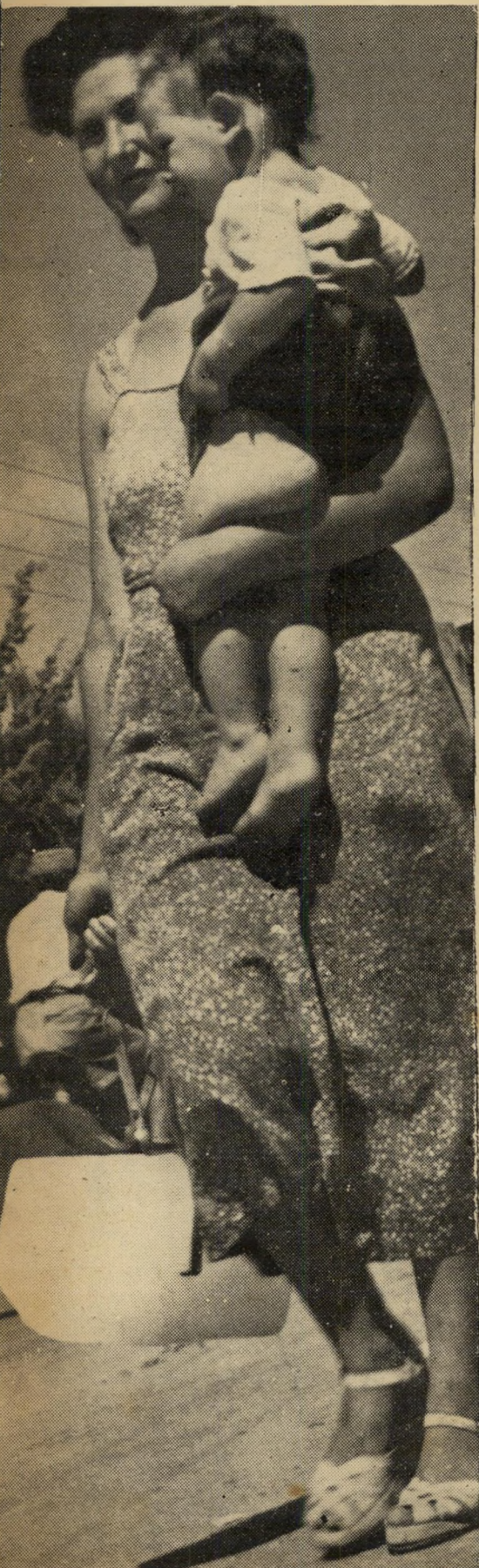
הרבע הנדוד : היא עמדה בתור, 4 שעות בתור, לחמה עם נשים היסטוריות, גברים ונעשים, שוטרים מחוממים. לבסוף הגיע הרגע המאושר : קיבלה את רבע הבלוק. חוזרת לביתה בשכונת התקווה.

משה גרצברג, מנהל המחלקה, עשה מאמ־צים נואשים, עבד יומם ולילה (במקום ל־ב) לות ירח דבש אחרי נשואיו) ; נעזר ע"י נתן נביאזקי, מפעילי ההגנה לשעבר שקיבל ל־ידין את ארגון מפעלי הקרח. אולם קשה היה להזיז את עגלת־הקרח. אי־אפשר היה עוד לתקן את הונחת השנים.