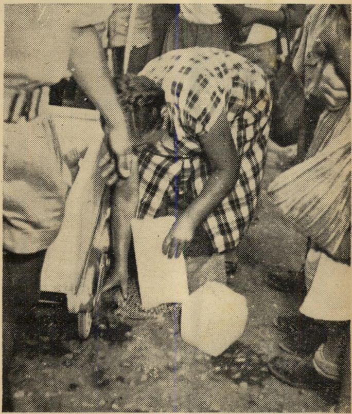
רעב גם הוא, צמא למים קרים. היא השיגה את האוצר הלבן אולם כשניסתה לפרוץ דרך ההמון הצפוף נפל הגוש, נשבר. היא מאבדת את השליטה על