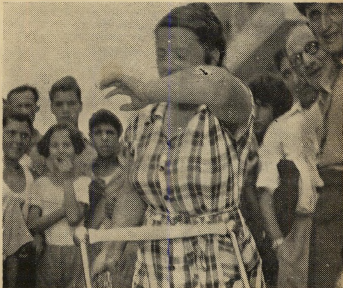
עצמה, עומדת ברחוב בבכי. טרגדיה קטנה? אולי. אבל לאותה אשה היתה זאת טרגדיה מחרידה, שבגללה היתה מוכנה להפיל ממשלות, אולי גם לחולל מהפכות.