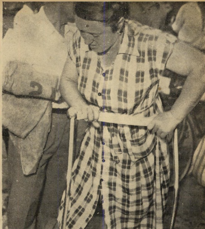
בסך הכל נשבר גוש של מעט מים קפואים. אולם האשה מיואשת. שעות עמדה בתור. הילד בכה בעגלה. הוא רעב. עוד מעט יחזור הבעל מן העבודה.